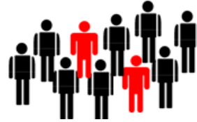
Figura 01: Gráfica de cifras internacionales de discapacidad. Elaboración propia.

De este último punto, un 82% de las personas con discapacidad vive por debajo de la línea de pobreza y a menudo carece de acceso a áreas clave del desarrollo, incluyendo salud, educación, formación y empleo (International Labour Organization, 2015). En un desglose a América Latina, cerca del 80% de los niños con discapacidad no tiene acceso a la educación debido a barreras exógenas a su condición, y sólo uno de cada 20 termina la secundaria.