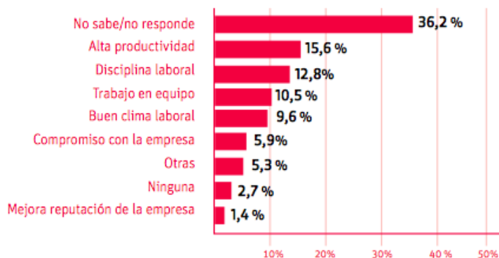
Gráfico 01: Evaluación de los encuestados – Ventajas de incluir a Personas con Discapacidad