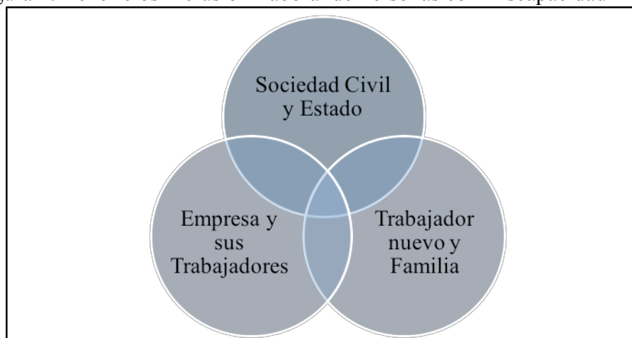
Figura 2: Beneficios Inclusión Laboral de Personas con Discapacidad

En el contexto de los beneficios, las encuestas han declarado que existen oportunidades para las empresas que contraten a personas con discapacidad dentro de su fuerza de trabajo. Sin embargo, de manera paralela, los beneficios se multiplican a la persona con discapacidad, a su familia y a la sociedad en general. Como registro de ello, un estudio nacional de la OIT retrató la realidad nacional y los beneficios en cada uno de los grupos de interés, con una encuesta que considera distintos factores para distintos actores (Organización Internacional del Trabajo, 2013).