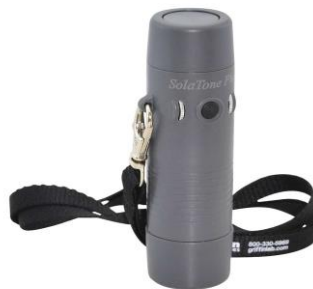
Imagen número 1: Fotografía referencial de laringe electrónica.